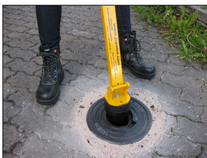
2. Venttiilihatun kansi nostetaan.