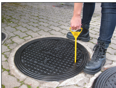
2. Kaivonkansi nostetaan.