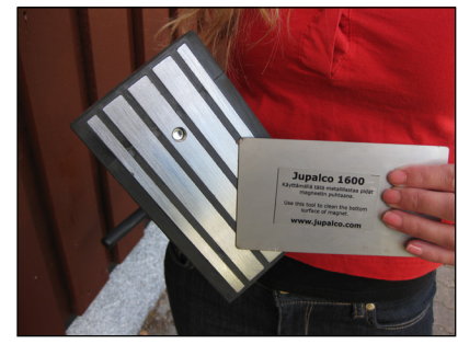
Magneetin pinnan puhdistus suoritetaan mukana tulevilla metalli-lastalla.