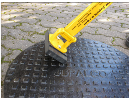
3. Magneettinostin irroitetaan kaivonkannesta kääntämällä nostinta sivulle.