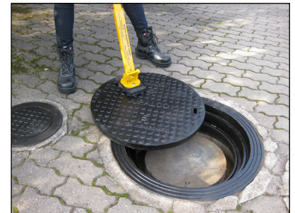
2. Kaivonkansi vedetään sivulle kaivon viereen.