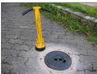
1. Magneetti asetetaan venttiilihatun kannen päälle.