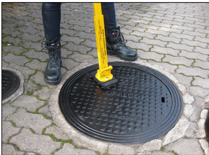
1. Magneetti asetetaan kaivonkannen reunaan ja kantta nostetaan.