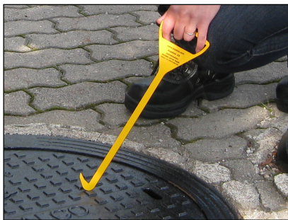
1. Kaivokoukku työnnetään kaivonkannen nostoreikään.