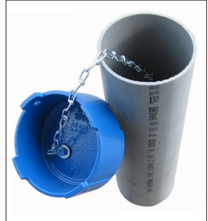
Putkenhatun ketjukiinnitys, lisävaruste