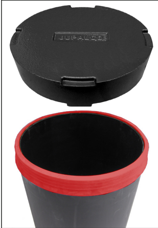
Putkenhatun tiiviste, lisävaruste Tiiviste asennettu muoviputken ulkokehälle.