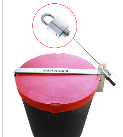
Putkenhatun lukitussalpa, lisävaruste Riippulukkolukitus (lukko ei sisälly toimitukseen).