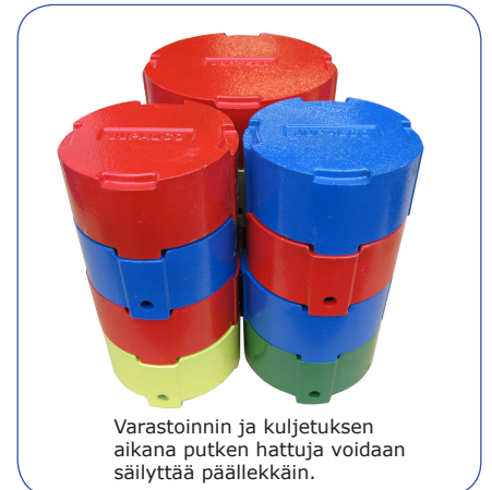
Varastoinnin ja kuljetuksen aikana putken hattuja voidaan säilyttää päällekkäin.